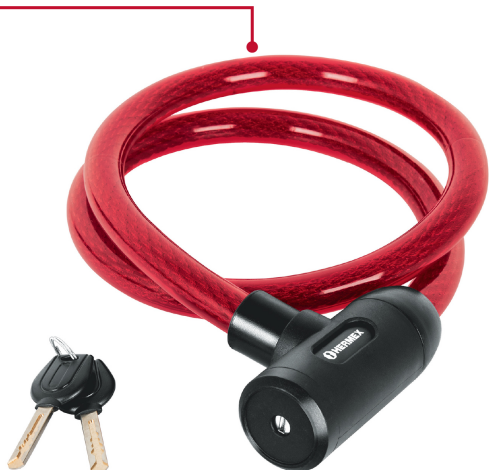
Cable de acero trenzado