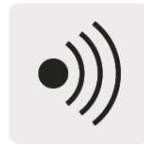
Prueba de continuidad audible